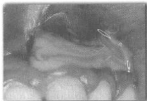
درناژ داخل دهانی اگرودای چرکی

تورم‌های بافت نرم با منبع اندودانتیک بایستی برای درناژ باز شوند